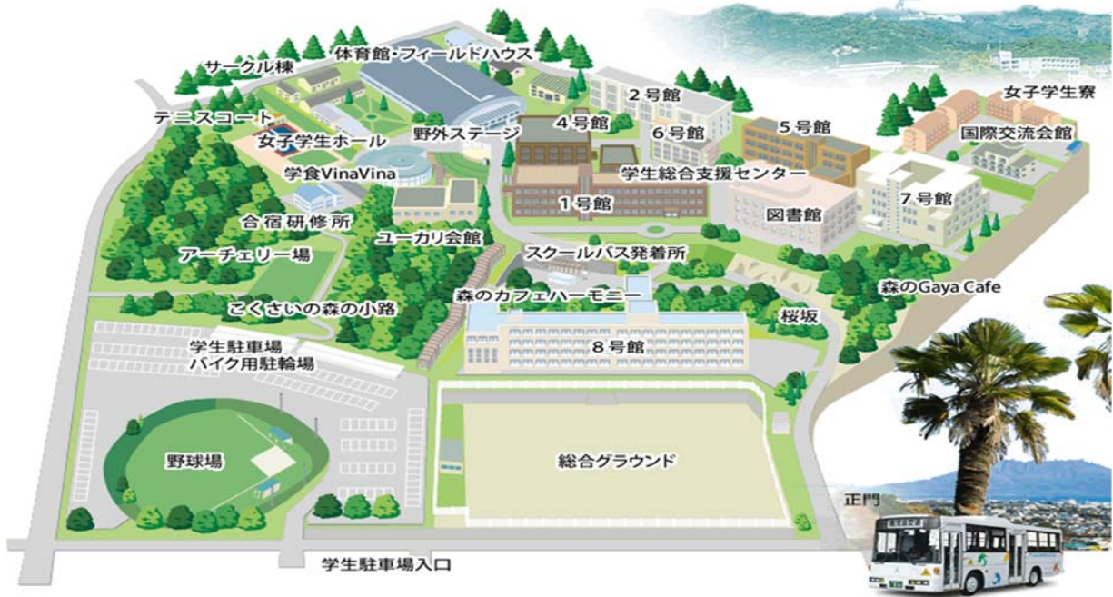
大会会場・7号館の位置と外観